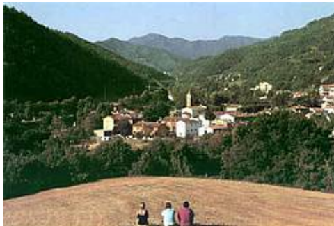
Panorama di Borgo Pace – Foto di Franco Fontana

Chi arriva a Borgo Pace trova un paese ospitale, invitante, con buona cucina, noti ristoranti e alberghi. È un luogo ideale per vivere una vita serena, a stretto contatto con la natura, dalla quale si assorbono ritmi e benefici influssi.